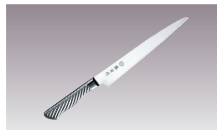
⑦藤寅作 パンスライサー