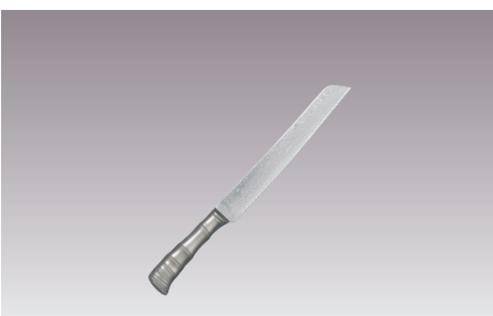
⑨響十 ブレッドナイフ 両