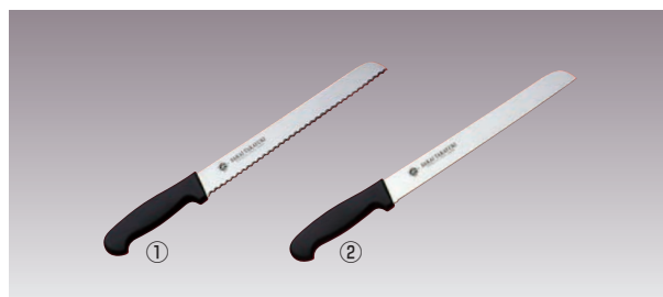
堺 孝行 PC柄