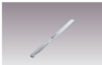
⑥ブライトM11PRO ブレッドナイフ