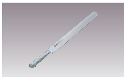
⑤ブライトM11PRO ウェーブナイフ(パン切)