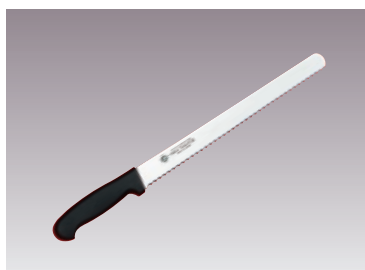
③グランドシェフ PC柄ウェーブナイフ