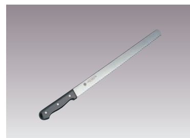
④グランドシェフ ウェーブナイフ