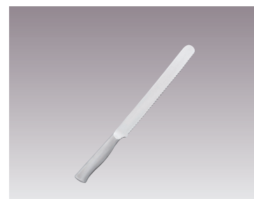
⑩柳宗理 ブレッドナイフ